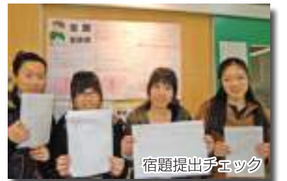
宿題提出チェック